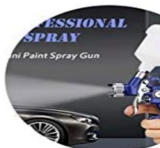
Pistola per verniciare a spruzzo

Quote di partecipazione per allievo 10 euro , per informazioni :